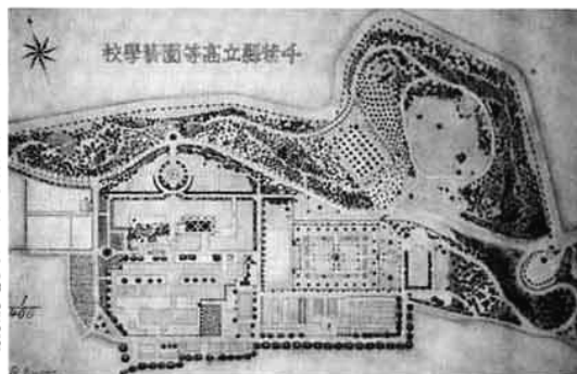
図2：大正6年頃の千葉県立高等園芸学校キャンパス彩色平面図(湯浅四郎助教授測量・作図)