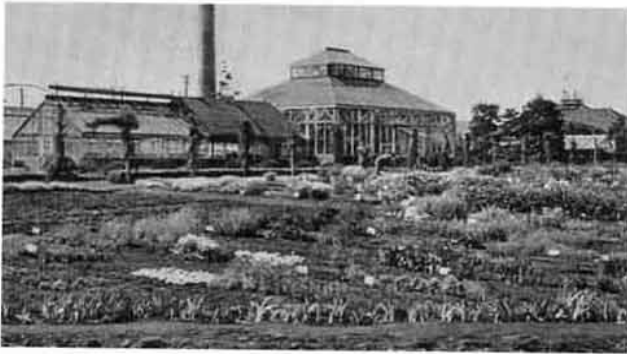
写真1：昭和10年造成の観賞温室