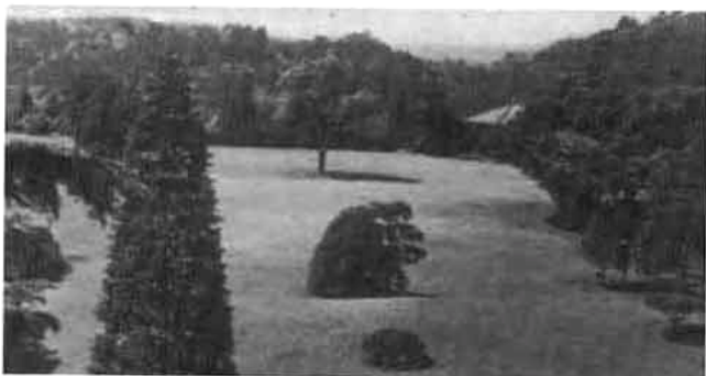
写真11: 講堂南側から俯瞰したイギリス風景式庭園(昭和10年当時) 右手奥に四阿が見える