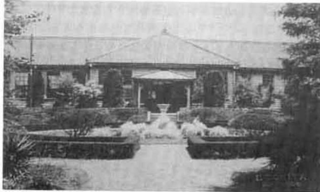
写真2：イタリア式庭園日時計から当時の校舎玄関