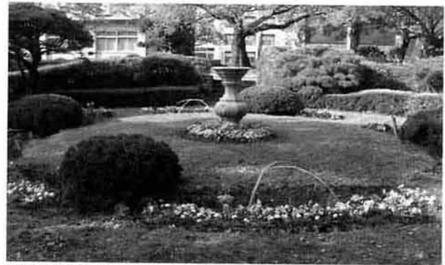
写真4：現況の日時計花壇とタギョウシヨウ