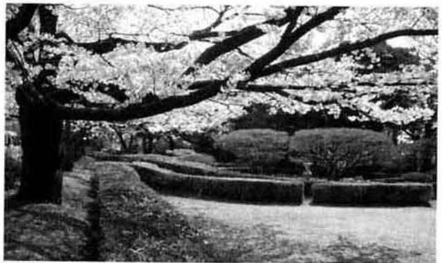
写真5：80種もの樹種からなる世界最多の混ぜ垣の現況