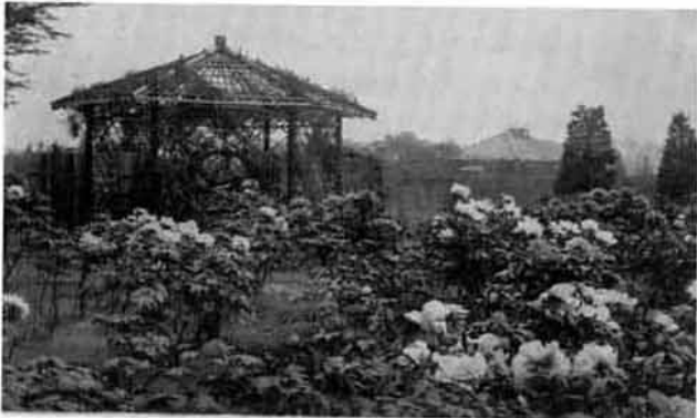
写真3：バラを絡めた四阿と牡丹園(大正13年)