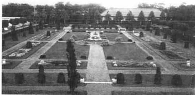
写真7：昭和4年当時のフランス式庭園 四周を取り囲む小さな円筒形樹形がチャボヒバ、その左右列背後の球形樹形がトゲナシニセアカシアのスタンダード樹形、正面奥がユリノキ並木

明治43年に起工し45年に竣工したフランス式庭園は、フランスのヴェルサイユ宮殿に代表されるフランス平面幾何学式庭園をモデルとした「沈床庭園」sunken gardenである(写真7)。周囲より一段低く掘り下げた沈床庭園とされたのは、幾何学式構成の全体を俯瞰しやすくするためである。但し、庭園を構成する樹木が大きいと庭園が小さく見えるため、樹高を低く抑える剪定がほぼ百年に亘って為されてきている。庭園を取り囲む百本を超えるチャボヒバのトピアリーは樹高1m強の円筒形で約百年に亘って透かし剪定されてきた和洋折衷樹形として極めて貴重である。また、庭園の南と北を仕切るスタンダード仕立てのトゲナシニセアカシアは、明治44年日本で初めて庭園論を講義した