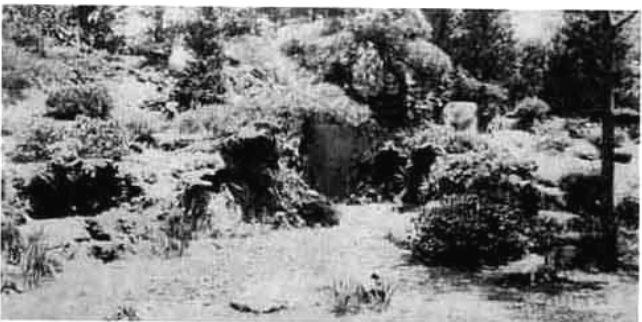
写真12: 日本の枯滝石組みに耐乾性植物を植栽したロックガーデン(大正3年造成)

末造成の五百城文哉の庭やそれに続く東京帝国大学日光植物園(明治35年開園)が岩山の各所に高山植物を配するものであるのに対して、大正3年造成の本キャンパスのロックガーデンは日本庭園伝統の枯れ滝石組みに乾燥に強い植物を配した点に特徴がある(写真12)。換言すれば、前二者が西洋のロックガーデンを踏襲した植物学的庭園であるとすれば、後者は景観構成をも意図した日本的ロックガーデンの端緒と云えるものである。