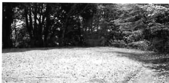
写真10: イギリス風景式庭園南部の現況