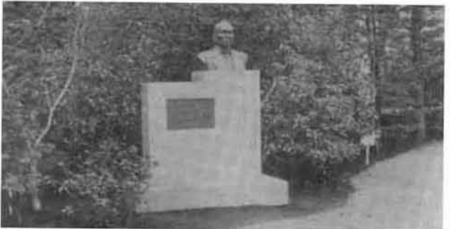
写真6：イタリア式庭園西端の第2代赤星朝暉校長胸像 (高村光太郎作・昭和11年設置)

から北に向くと、中央に日時計を配したイタリア式庭園があり、その向こう正面に校舎玄関を望むことになる(写真2)。