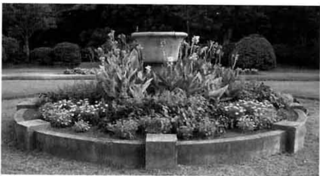
写真8：大正天皇即位大典を記念して大正4年に設置されたフランス式庭園中央のフラワーベース(現況)